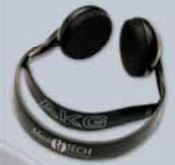
Kopfhörer MT-70 IV Art.-Nr. 7961 • 75,00 €