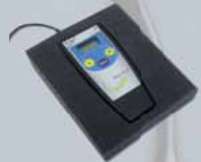
Schaumstoffhalterung Art.-Nr. 9059 • 15,00 €