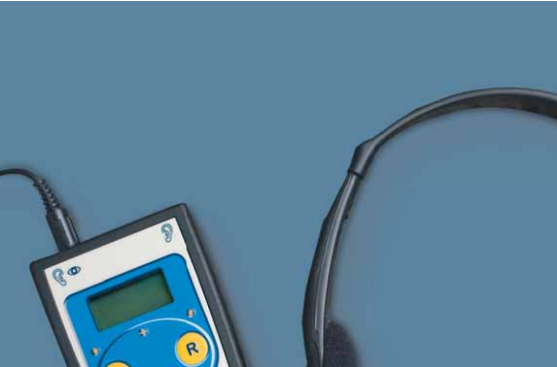
Brain-Boy ® Art.-Nr. 2222-Set 199,00 €